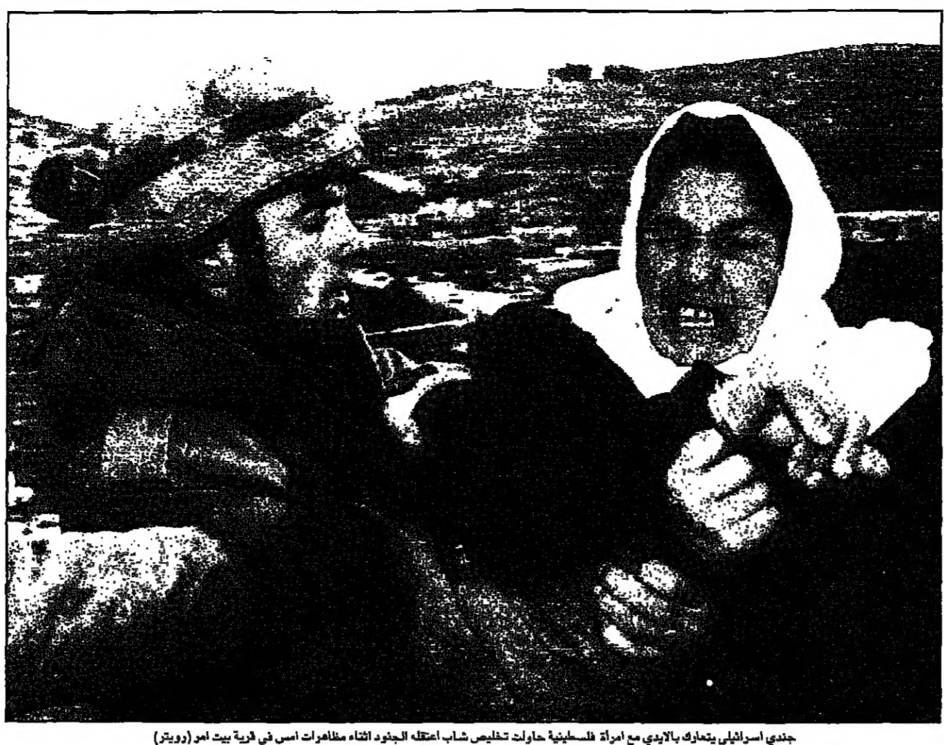
جندي إسرائيلي يتحرك بالاندي مع امرأة فلسطينية عانت تخليص شاب اعتقله الجنود أثناء مظاهرات أمس في قرية بيت امير

المخابرات الإسرائيلية، رصدنا اتصالات بين منظمة التحرير الفلسطينية وحساس ومنظمات أخرى مشغول في حركة المقاومة الإسلامية التي قتلت عشرات الإسرائيليين خلال هجمات قبل عام.